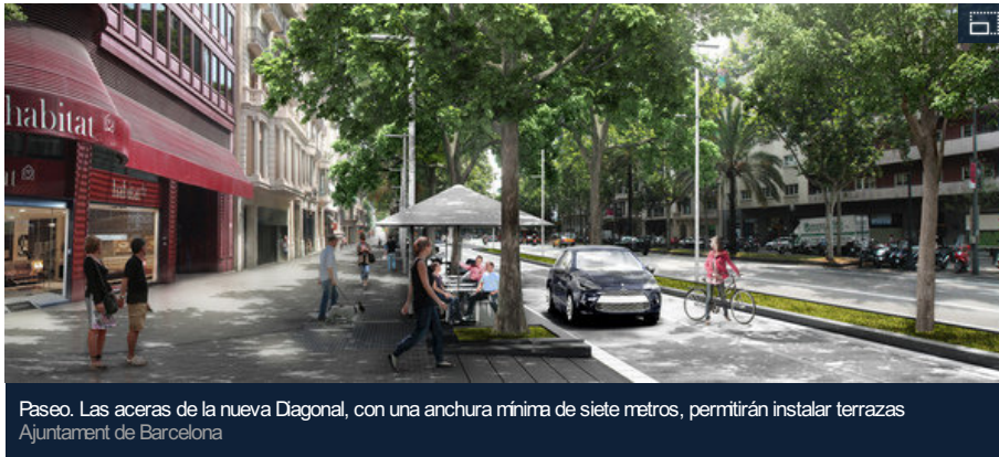
Paseo. Las aceras de la nueva Diagonal, con una anchura mínima de siete metros, permitirán instalar terrazas